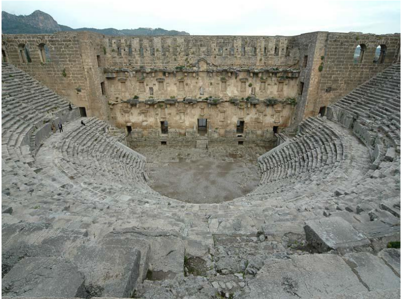
Doc. 6 Théâtre romain d'Aspendos (Asie Mineure), II e siècle PCN.