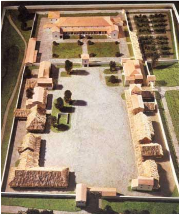
Doc. 7 Reconstitution d'un domaine agricole gallo-romain datant du II e siècle PCN. http://www.archeosite.be