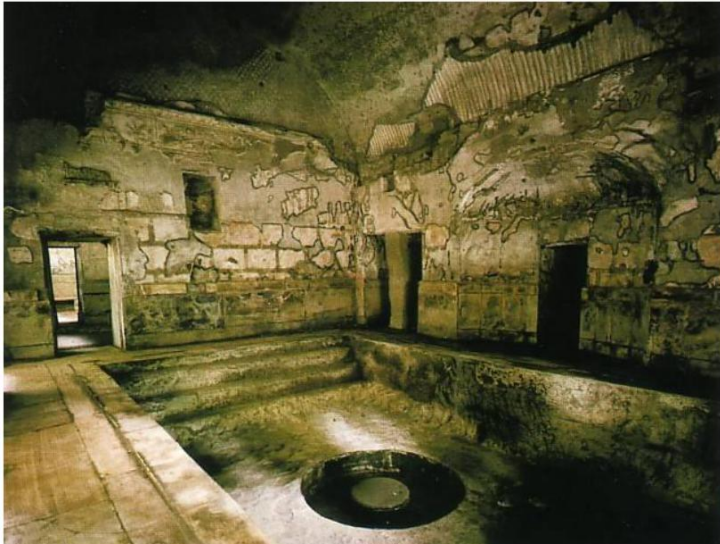
Doc. 5 Thermes de Caracalla (Rome)